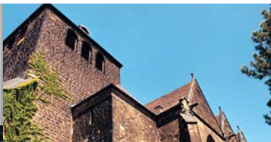
Ratskirche St. Martini

Die Gemeinde löste sich aus dieser ungewollten Abhängigkeit ihres Vorgängers, indem sie im ausgehenden 17. Jh. eine eigene Synagoge erwarb. Diese Synagogen fielen als einfache Fachwerkhäuser unter den anderen Häusern der Stadt kaum auf. Die jüdischen Gemeinden Minden und Petershagen wiesen eine breite soziale Streuung auf: vom einfachen Betteljuden bis zum reichen jüdischen Geldhändler. Doch im 19. Jh. gelang der soziale Aufstieg.