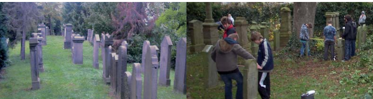
Jüdischer Friedhof Hausberge