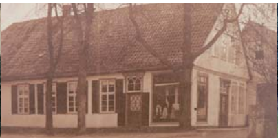
Stätte Nr. 45