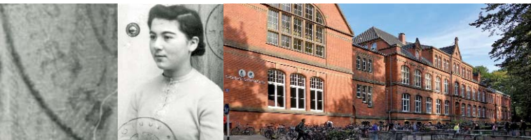
Aufeinander hören – Herder-Gymnasium