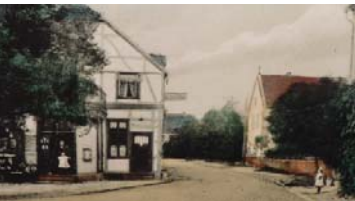
Haus Ehrlich Nr. 8