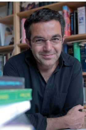
Dr. Navid Kermani